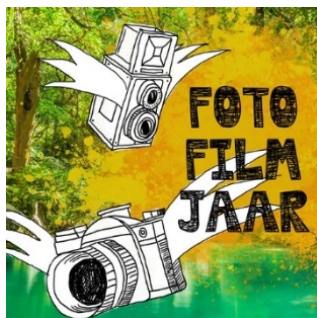
Foto / Filmjaar Vught 2018 - 2019

Alle basisscholen in de gemeente Vught (met uitzondering van Kentalis) nemen deel aan het Foto / Filmjaar , met in totaal ruim 3000 leerlingen. Een omvangrijk project, waarbinnen vooral veel keuzemogelijkheden werden geboden aan de individuele leerkracht. Tijdens de Kick-off in oktober presenteerden aanbieders zich in pitches aan de Vughtse leerkrachten, die vervolgens hun eigen keuzes voor eventuele samenwerking maakten.